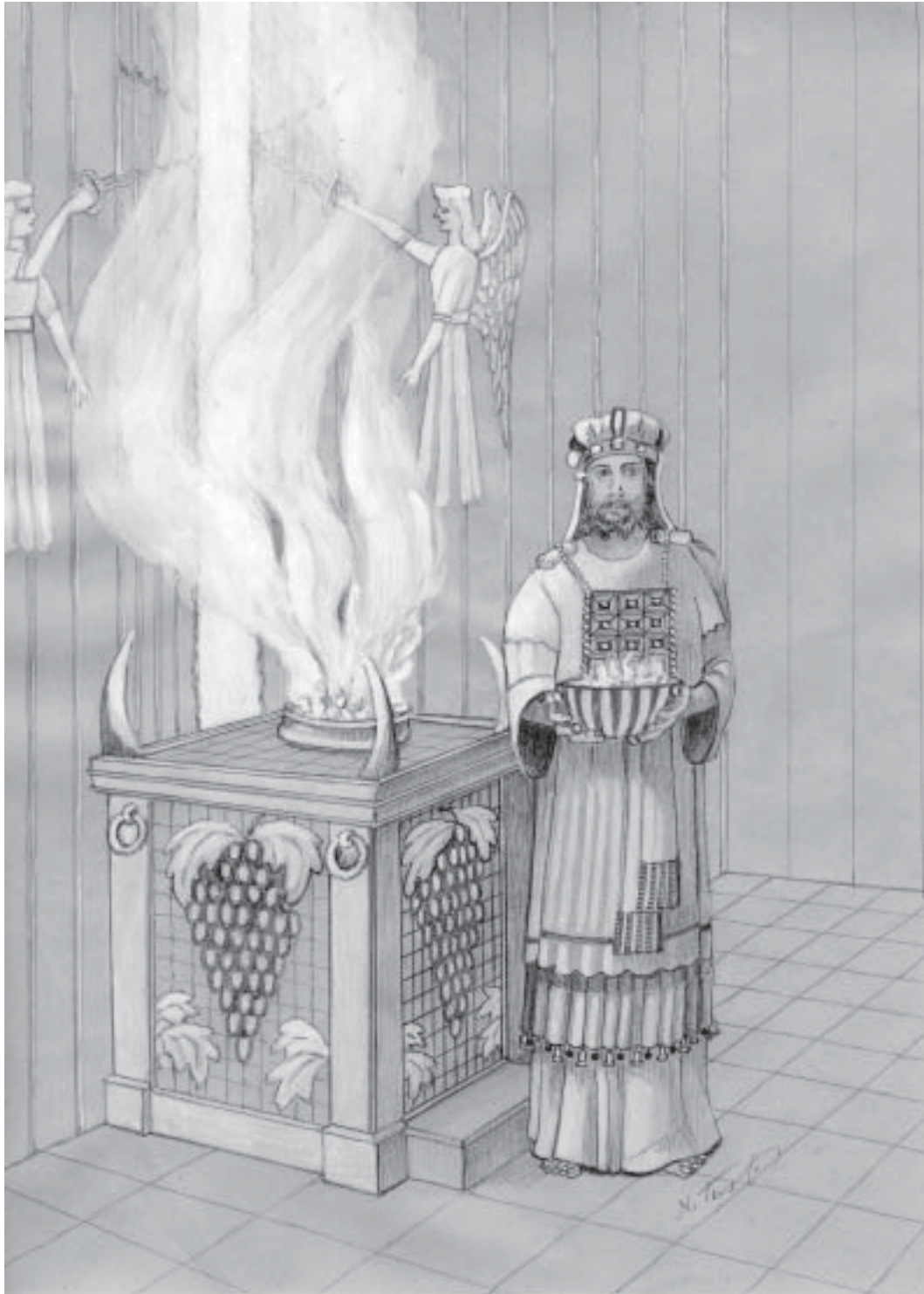
Jesus – den himmelske översteprästen framför det brutna förhänget Matt 27:51; Upp 8:2-7; Rom 8:34; Hebr 2:17;3:1