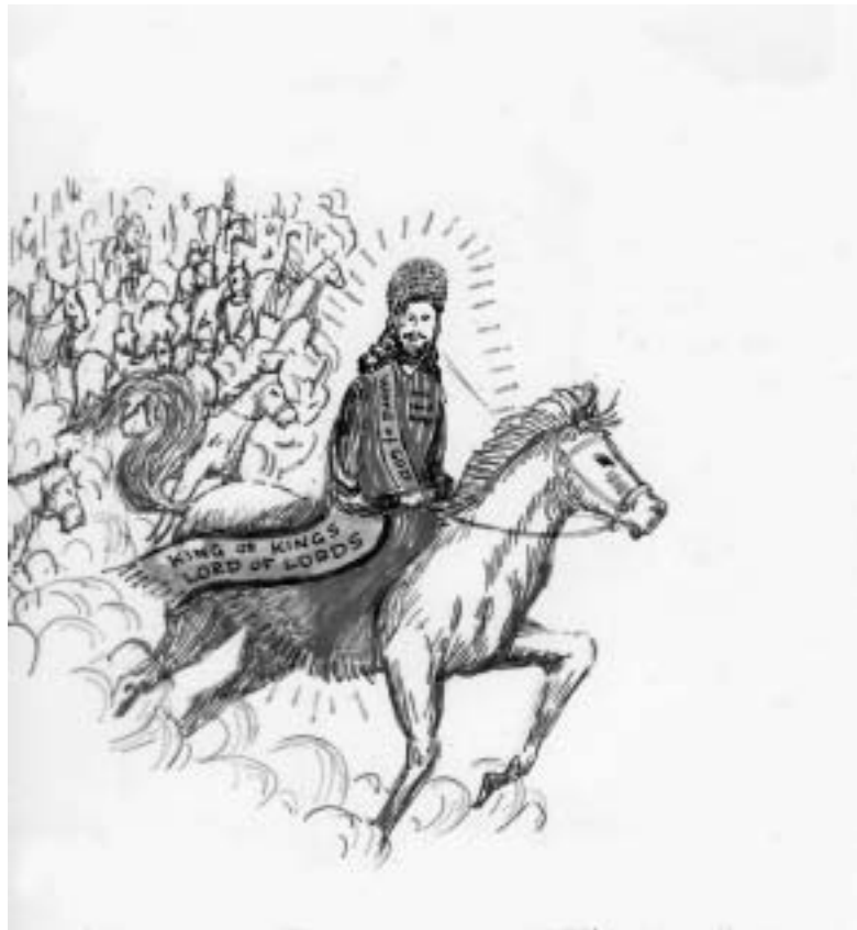
Jesus – Konungen – på den vita hästen Upp 19:11-16.