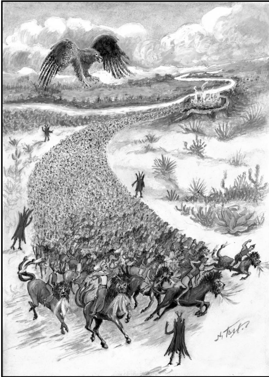
Demonhästarna dödar en tredjedel av mänskligheten – Ve, ve, ve över jordens invånare.