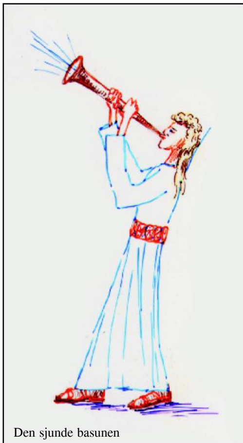
Den sjunde basunen