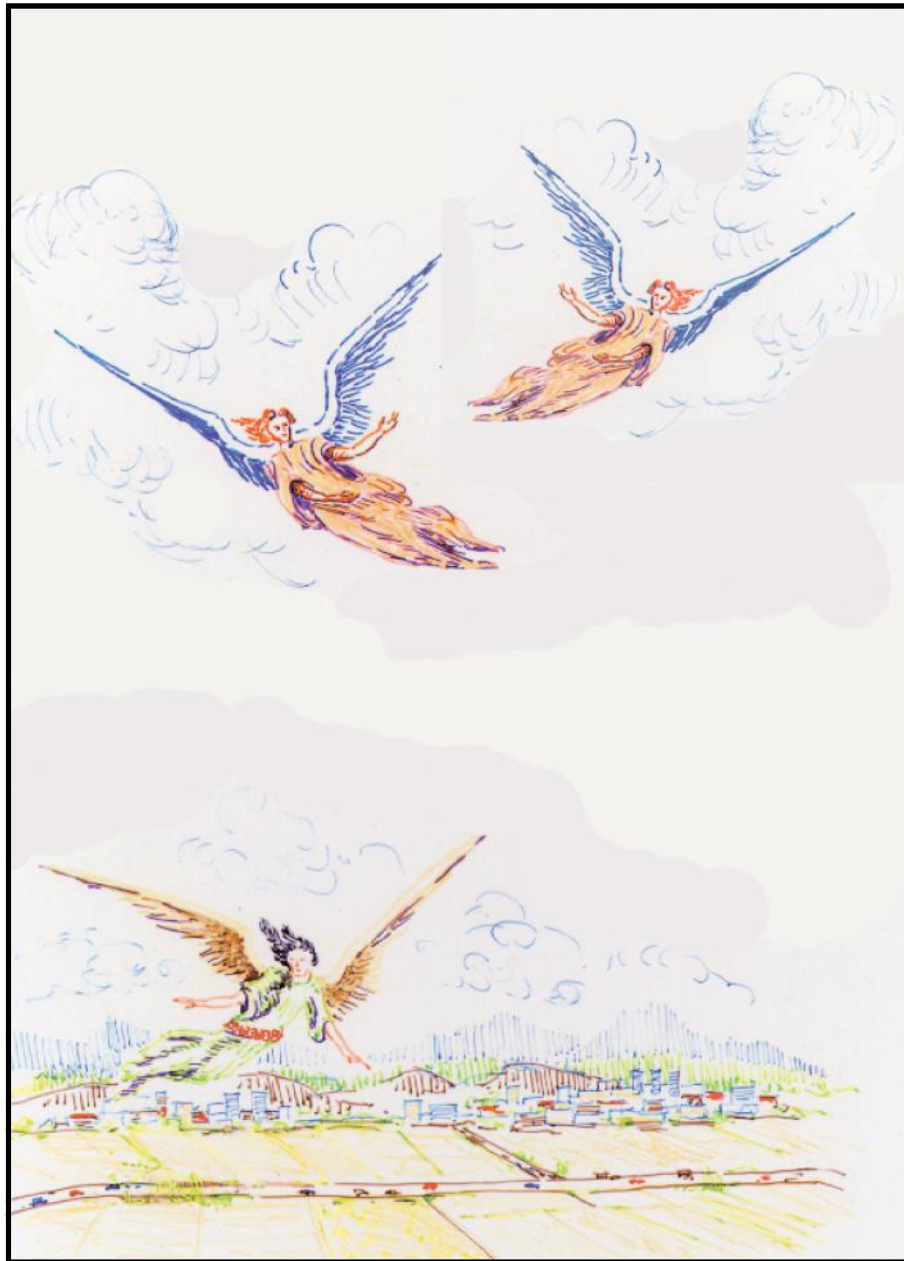
Tre änglar på himlen varslar om domen