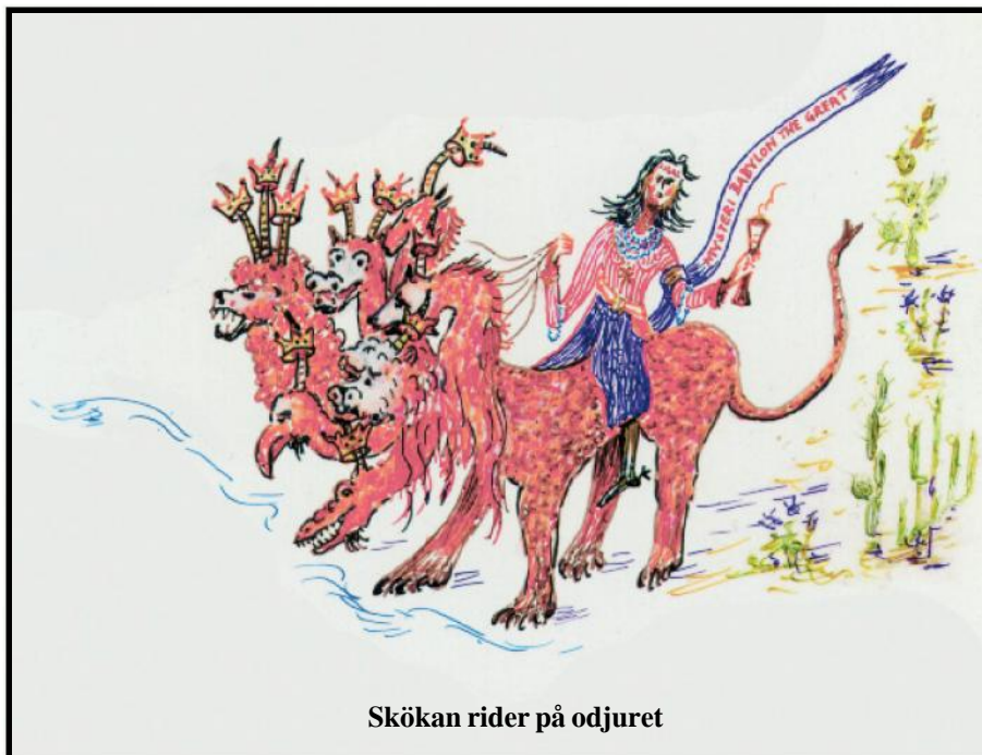
Skökan rider på odjuret

underordna sig det religiösa systemet (avfallen kristendom och islam, vilket betyder underkastelse) och dess ledare, som han dock efterhand kommer att utnyttja till sin fördel.