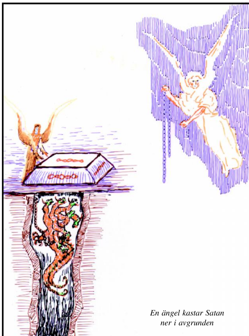
En ängel kastar Satan ner i avgrunden