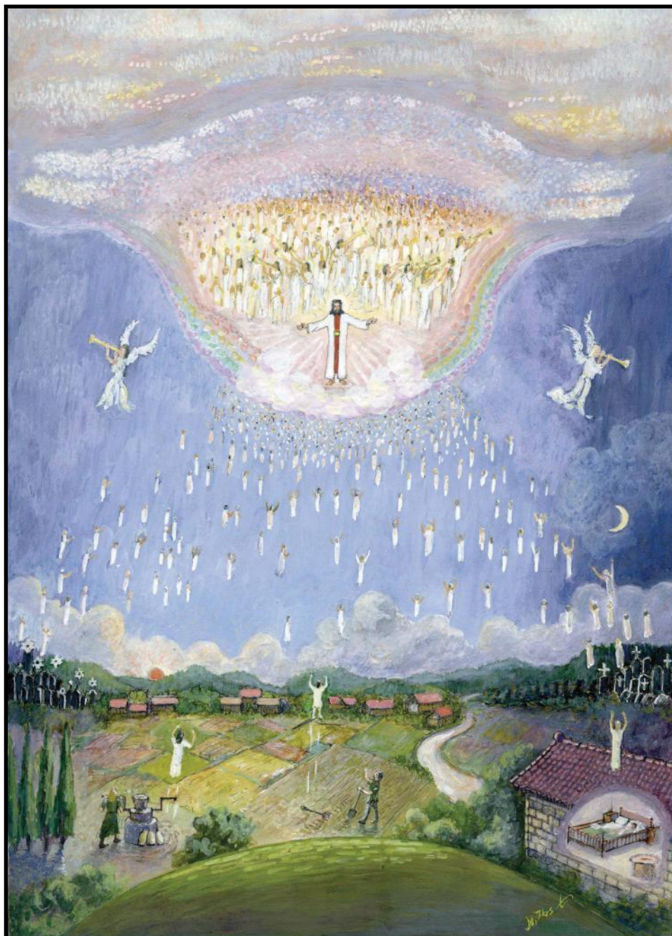
Kristi uppenbarelse i skyn för att hämta hem församlingen – Se, jag kommer snart och har med mig lön att ge åt var och en efter hans gärningar.